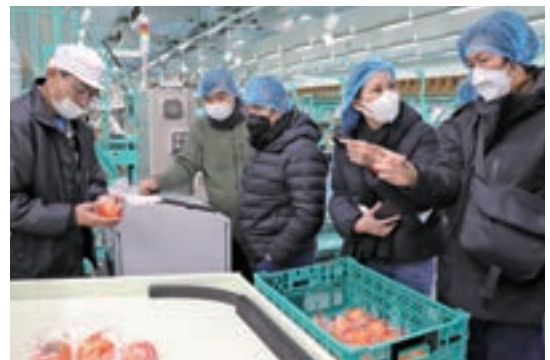
中央選果場を視察する関係者

タイ屈指の名門ホテル「マンダリン オリエンタル バンコク」のレストランで開催中の「福岡フェア」で、JA筑前あさくら産の「冷蔵柿」を使った創作料理が期間限定で提供され、人気を集めています。同フェアは、福岡県とタイの首都バンコク都との友好提携15周年記念の関連イベントとしてホテル内の飲食店3店舗で2月末まで開催。「冷蔵柿」は、日本料理店「キヌバイタカギ」のコース料理の先付として使われています。