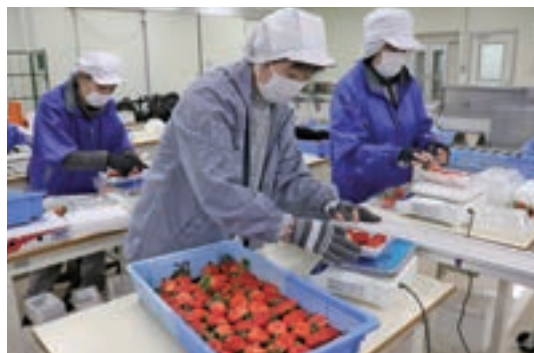
調製作業がたけなわの中央PC