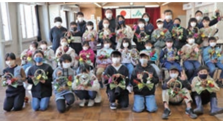
▲「あぐりキッズスクール・第4講」(昨年12月10日) 冬野菜の収穫体験(左) しめ縄作り集合写真(右)