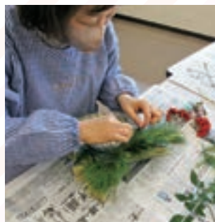
▲センスがきりと光るしめ縄に仕上がりました