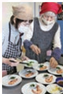
▲蒸し雑煮やエビの旨煮などを作りました（写真：甘木地区）

女性部は昨年12月、活動リーダーを講師とし、「おせち料理&しめ縄作り教室」を各地区で開きました。午前中はおせち料理を作り、試食を兼ねた昼食会後には、しめ縄作りと盛りだくさんの内容で、師走の1日を楽しく過ごしました。