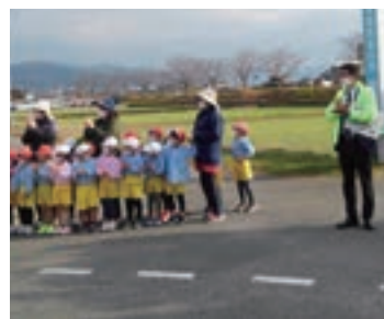
馬田小学校マラソン大会の応援

私は主に金融・共済事業に関する推進業務の管理、渉外担当者の育成に携わり、毎日が充実しています。また、JAの食農教育活動として毎年小学生を対象とした田植えや稲刈り体験に参加する中、地元へ貢献したい思いから令和4年度、PTA会長の職をお受けしました。