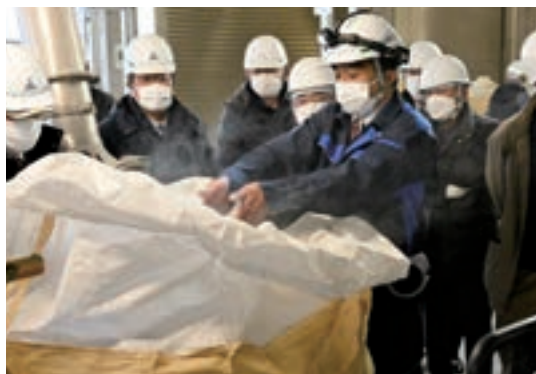
和白水処理センターで説明を受ける役員ら

JA役員は1月27日、再生リンを使ったエコ肥料の普及拡大と循環型農業構築への理解を深める目的で、福岡市の下水道処理施設「和白水処理センター」を視察しました。