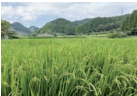
水稲新品種「恵つくし」