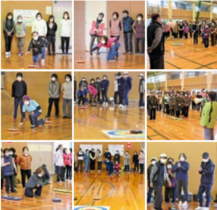
笑顔あふれるひとときとなったカローリング大会