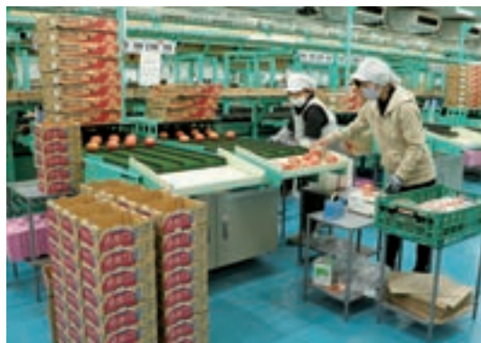
順調に選果が続く中央選果場

冬春とまと部会では、1月から始まった冬春トマト「感激73」の出荷が順調に続いています。選果の拠点となる中央選果場には続々と冬春トマトが持ち込まれています。