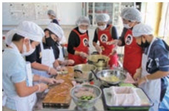
料理に挑戦する児童

甘木地区女性部は昨年11月25日、食農教育活動の一環として朝倉市立金川小学校の授業で大豆を使った料理体験を指導しました。