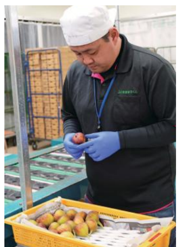
丁寧に選果するJA職員

イチジク「とよみつひめ」の県内最大の産地である管内で5月18日、令和8年産の出荷が始まりました。今シーズンも順調に生育は進み、天候にも恵まれたことで糖度も高く、玉太りや色づきも良好で高品質に仕上がっています。加温栽培から始まった出荷は、7月上旬に無加温、8月上旬に露地栽培へ続き、