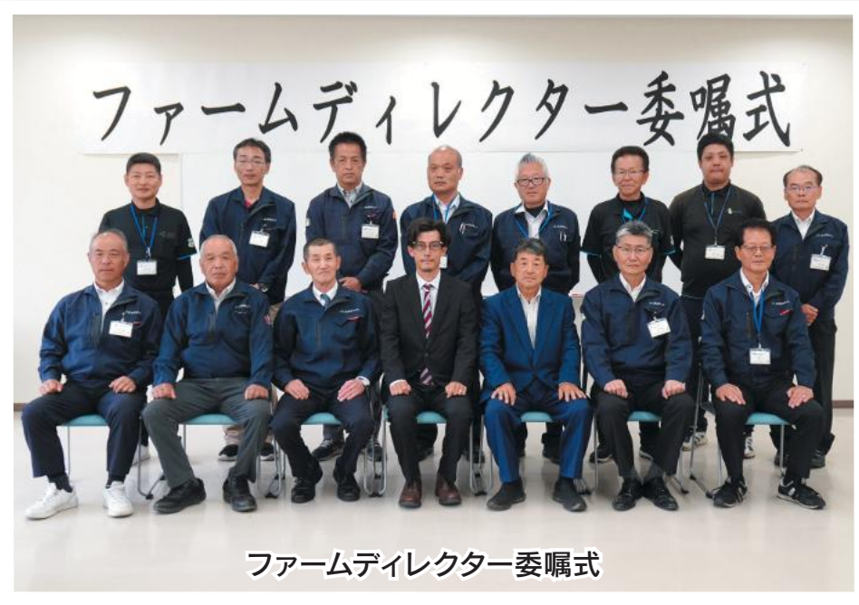
ファームディレクター委嘱式