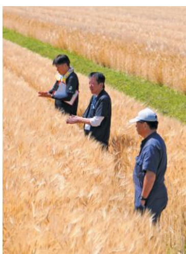
生育状況を確認する営農指導員ら

5月上旬には収穫時期を見極めるため、地区ごとに刈り取り判定会を実施。生産者やJA職員らが圃場を巡回し、登熟状況や水分量を入念に確認した上で