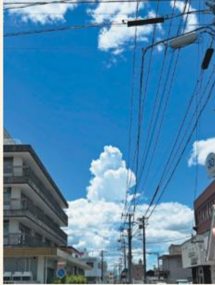
朝倉高校の「からたち門」から撮影しました。入道雲と建物の対比をきれいに写せました。(岩谷)