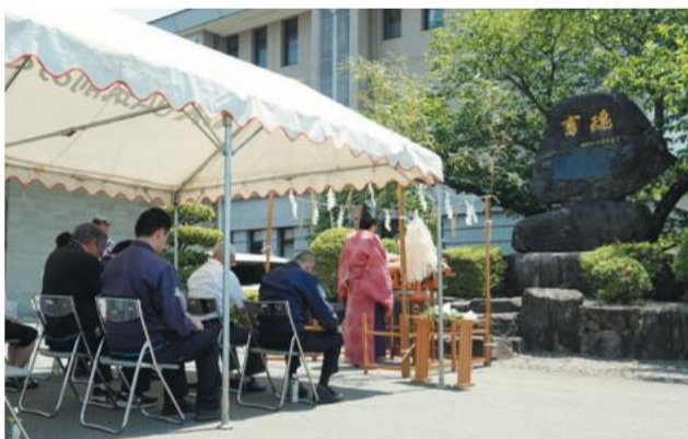
▲畜魂慰霊祭(朝倉市・5月18日)