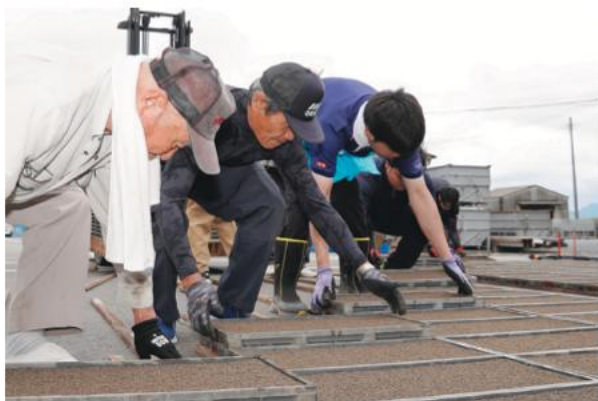
▲三輪地区普通作部会 水稲箱苗作り(筑前町・5月22日)