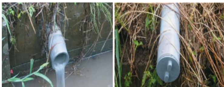
図 暗渠栓開閉の様子（左：開栓、右：閉栓）