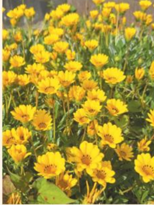
太陽に照らされてより黄色が鮮やかになり、太陽の方向をむいて咲く姿に力強さを感じました。(坂田)