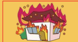
火災 ※地震などによるものを除きます。