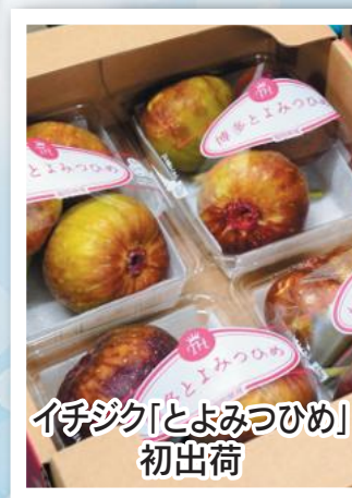
いしづく「とよみつひめ」 初出荷