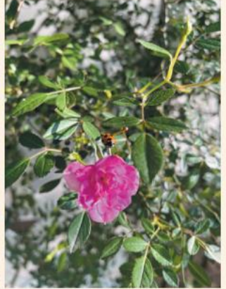
つるバラにテントウムシが止まることは、「愛情や夢が、太陽のエネルギーによって幸福として実る」ことを意味していて、すてきな光景を共有したいと思って写真におさめました。(久次)