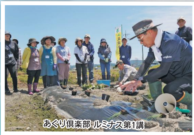
あぐり倶楽部 ルミナス第1講