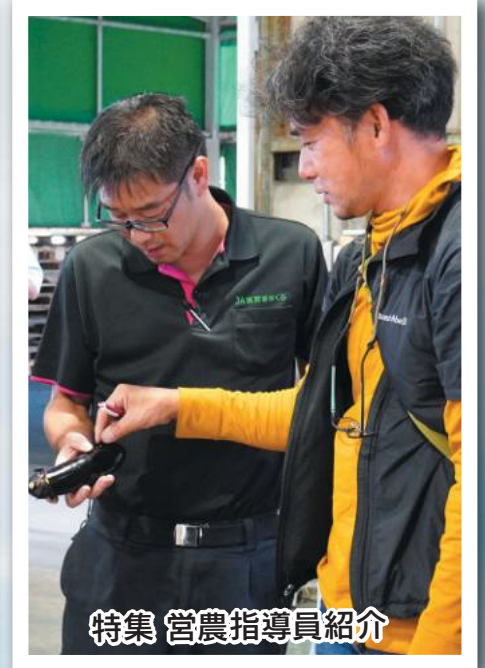
特集 営農指導員紹介