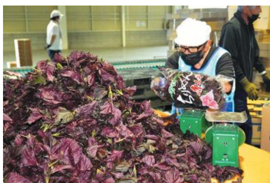
一袋ずつ丁寧に袋詰めをする選果員

赤シソは梅干しの色付けやふりかけ、シソジュースなどに広く使われ、ピタミンやミネラルが豊富で、夏バテ予防にも最適です。