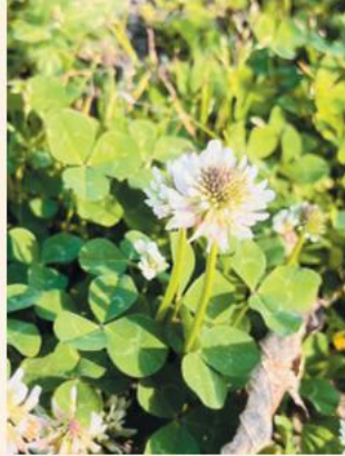
緑の中にシロツメクサが映えていたのが印象的だったので撮影しました。(唐川)