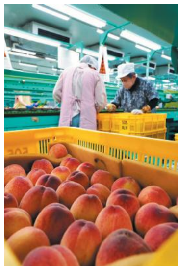
丁寧に選果を行う様子

5月18日、ハウス栽培の桃「日川白鳳」の出荷が始まりました。今シーズンは天候に恵まれ、果実全体が鮮やかに色づいた高品質な仕上がりとりました。中央選果場には生産者が丹精込めた桃が次々と持ち込まれ、丁寧に選果が行われました。糖度が高く、濃厚な甘みと果汁が魅力で、総出荷量も平年並みを確保でき